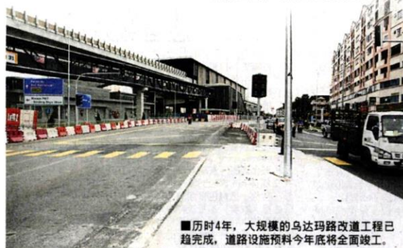
■历时4年，大规模的乌达玛路改道工程已趋完成，道路设施预料今年年底将全面竣工。