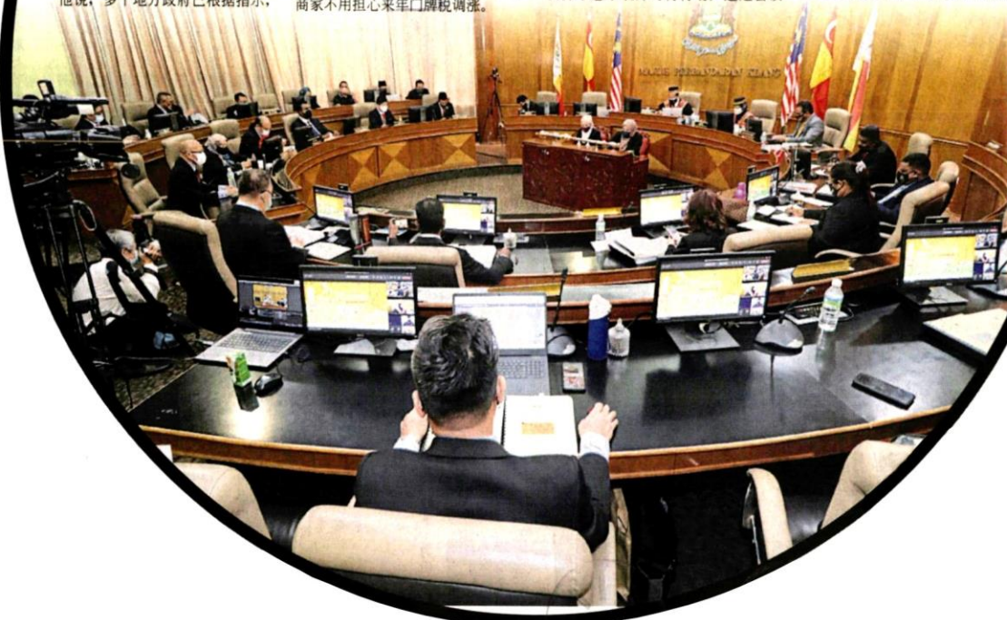
■ 议, 商过区内的大小民生课题 巴生市议会召开10月份常月会

他也提到, 市议会每年发出的门牌税单, 成本高达百万令吉, 因此市议会也正在考虑其它途径, 例如通过WhatsApp发送税单, 以便节省成本。